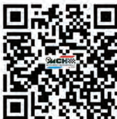
Rundschau mit Anmeldung