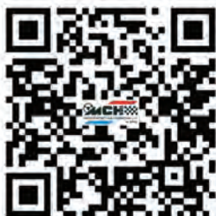
Rundschau ohne Anmeldung