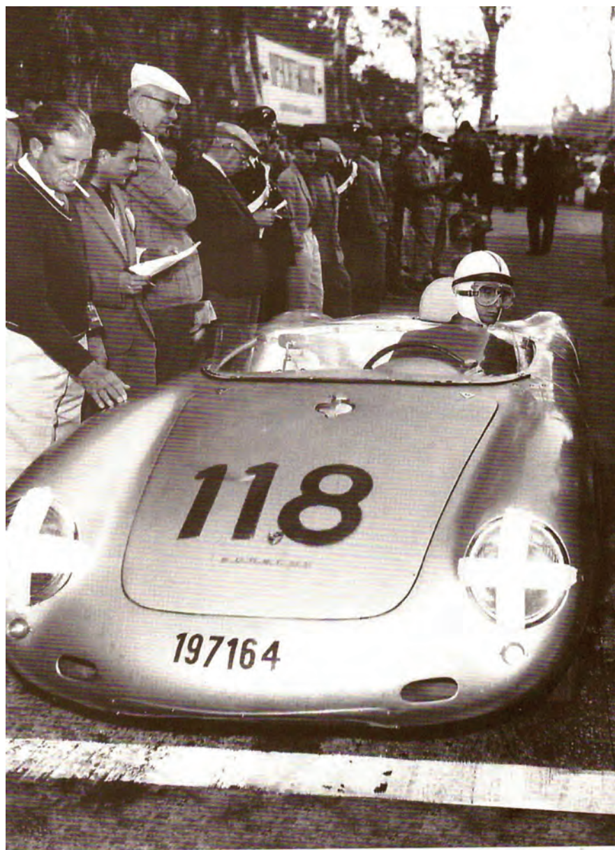
Targa Florio 1959