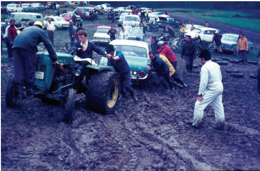
Motocross des MCH Hintere Ölmühle 19. April 1970