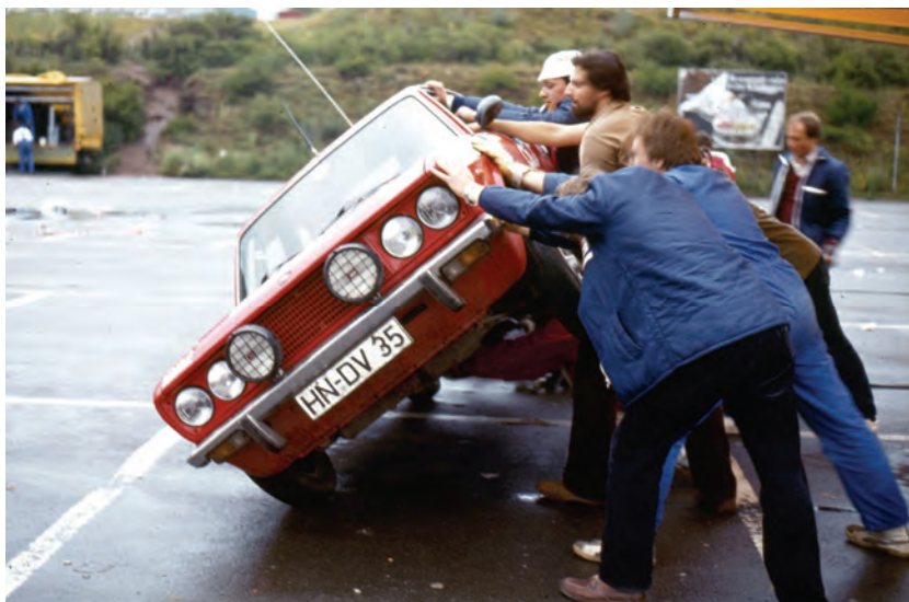
Rallye Vorderpfalz 1981 Servicepark