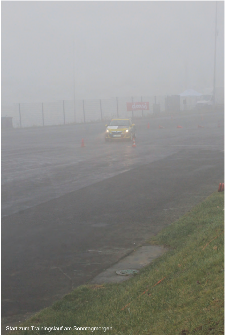
Start zum Trainingslauf am Sonntagmorgen