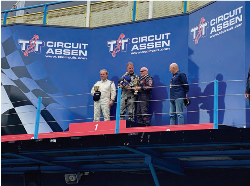
Siegerehrung in Assen